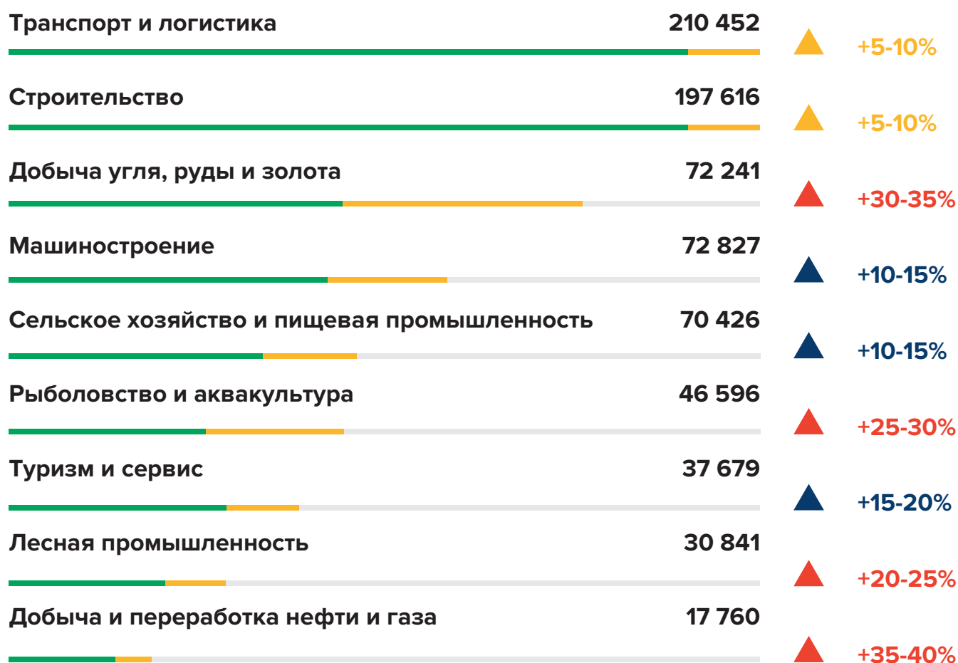
ГРАФИК 1 – ПОТЕНЦИАЛ РОСТА РЫНКА ТРУДА ПО ОТРАСЛЯМ

Значительный рост рынка труда ожидается в следующих отраслях: добыча и переработка нефти и газа, добыча угля, руды и золота, рыболовство и аквакультура, лесная промышленность.